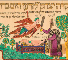
ברחם אלה נגדו שבו לכם פה עם החבור ואני והזנוג נלכה עדי כה :