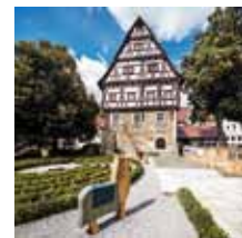
Museum im Storchen

Städtisches Museum im Storchen Wühlestraße 36 Tel. (07161) 650-185 Öffnungszeiten: Di–Sa 13–17 Uhr Sa und Feiertag 11–17 Uhr Zeugnisse der Stauferzeit, Exponate der Stadtgeschichte, bäuerliche Kultur, Spielzeug.