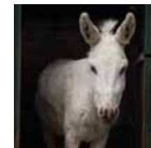
Im Tierpark Göppingen

Tierpark Göppingen e.V. Schickhardtstr. 25 Tel. (07161) 2 57 60 Öffnungszeiten: täglich 10–19 Uhr